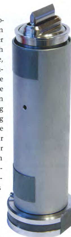
◀ Eine FDU Midi in der offenen Version wie sie bei diesem Projekt verwendet wird.

Seit dem Frühjahr 2020 sind in Kevelaer zwei neue Werkzeuge im Einsatz, mit denen eine Palette gefertigt wird. In ihnen vereint ist erstmals das Werkzeugbau Know-how der Nußbacher mit zwei Technologien, die ebenfalls aus den Entwicklungsabteilungen des Familienunternehmens stammen. Es handelt sich hierbei um das Heißkanalsystem Flat Die Unit (FDU) der 100 % Tochter FDU Hotrunner, Frankenthal, und um die Digitalisierungslösung Mould Monitoring von Digital Moulds, Sierning, Österreich,