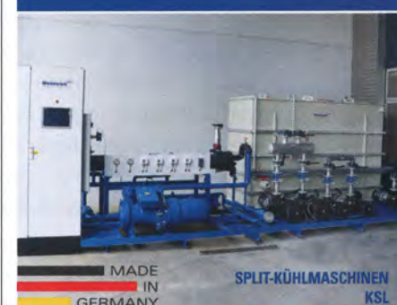
MADE IN GERMANY

Wasserbehandlung Carbonat-Ausfällanlagen Durchflussmessgeräte Heiz-/Kühlkombinationen Reinraumtechnik Prüf- und Testanlagen Werkz.-Konditionierung