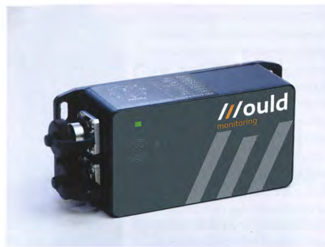
▲ Die Mould Monitoring Box erkennt, wenn sich der Spritzgießzyklus verändert.

Werkzeug ganz genau unter die Lupe und versuchten werkzeugbautechnisch sowie durch geringfügige Produktänderungen, die Performance zu optimieren.