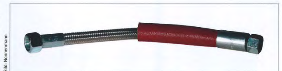
Schlauch verpresst mit roter Isolierung

Isolierungen Um Wärmeverluste in der Kunststoff- und Gummiverarbeitung sowie im Werkzeug- und Formenbau zu vermeiden, bietet Nonnenmann , Winterbach, passende Komponenten für die Wärmeisolierung an Werkzeugen und Temperierschläuchen an. Für die Werkzeugisolierung umfasst das Portfolio verschiedene Typen von Wärmeisolierplatten mit unterschiedlichen Eigenschaften für den jeweiligen Einbau- und Verwendungszweck, von der Standardanwendung bis hin zu hohen Anforderungen an Druckfestigkeit und Temperaturbeständigkeit. Isolierte Werkzeuge reagieren nicht mehr so stark auf äußere Einflussfaktoren, wodurch ein gleichmäßiger Temperaturhaushalt im Werkzeug und ein stabilerer Produktionsprozess ermöglicht werden. Um es Anwendern einfach zu machen, übernimmt das Unternehmen auch die individuelle Komplettbearbeitung der Wärmeisolierplatten nach den Konstruktionsdaten der Kunden. Bei der Verwendung von Wärmeisolierplatten ist zu beachten, dass der direkte Kontakt mit Feuchtigkeit oder Wasserdampf vermieden